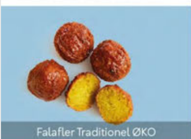
Falafler Traditionel ØKO