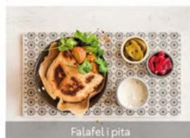
Falafel i pita