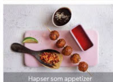
Hapser som appetizer