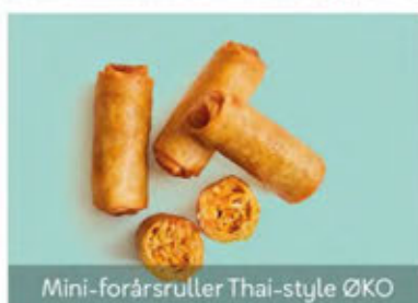
Mini-forårsruller Thai-style ØKO