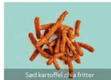
Sød kartoffel chia fritter