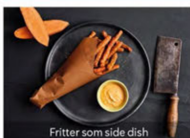
Fritter som side dish