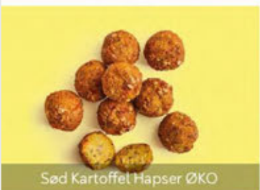
Sød Kartoffel Hapser ØKO