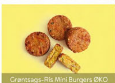
Grøntsags-Ris Mini Burgers ØKO