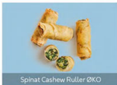
Spinat Cashew Ruller ØKO