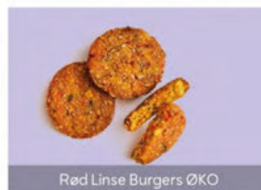
Rød Linse Burgers ØKO