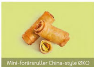
Mini-forårsruller China-style ØKO