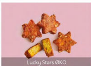
Lucky Stars ØKO