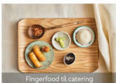
Fingerfood til catering